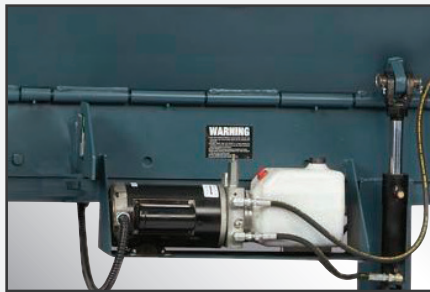
Cómodo montaje del motor y la bomba debajo del muelle/andén con depósito translúcido para un mantenimiento fácil