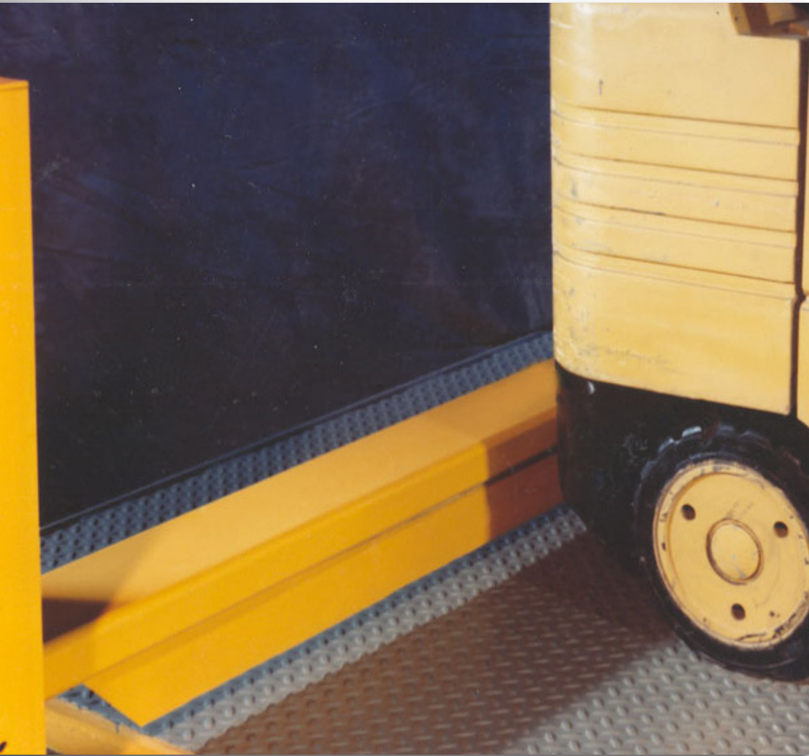
Se muestra barrera de elevación de barra