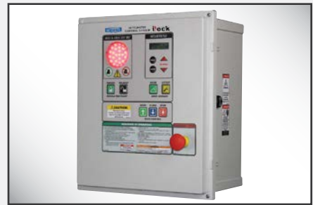
iDock Controls mejorados opcionales con pantalla de mensajes interactiva y que se pueden integrar con cualquier otro equipo de andén.