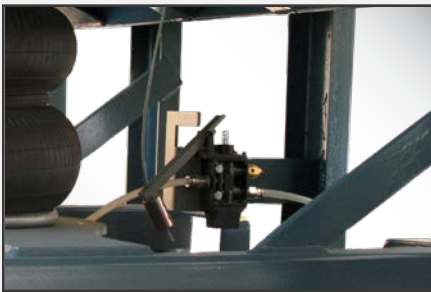
Accesorios de conexión rápida para una instalación simple.