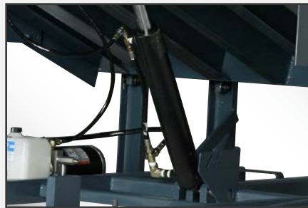
Los cilindros de puerto doble permiten que el líquido hidráulico se desplace en ambas direcciones en un sistema regenerativo.